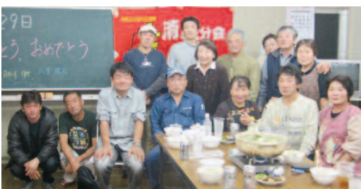
新加入者とアットホームな鍋会

この月間のありがたうおめでどうの会を、5分会で行いました。支部では、恒例のホールケーキをそれぞれの日で用意し、分会に配