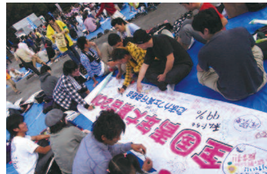
要求を書き込む青年達

「震災だから」じゃすまされな! まともな仕事と人間らしい生活を! をテーマに全国各地から様々な職業・学生の仲間たちが集まり、自分たちの今おかれている実情、学費問題、就活、就職後の労働環境問題など切実な訴えがありました。現在ニューヨークのウォール街で行われている貧困と格差に反対する世界の潮流もあり、「We Are The 99%」(私たちが99%)。1%の富裕層のために必死に働いているわけではない。「日本をかえるのも、私たち若者の連帯と行動。被災地と心をひとつにし、力をあわせて職場も、政治や社会もかえていきたいと思います。」とのアピール採択を行いました。