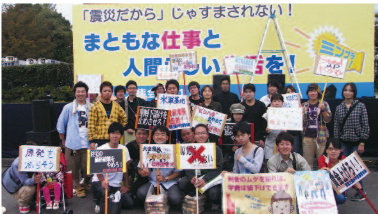
地域の青年達で集会に参加

東京都明治公園にて全国青年大集会2011が行われました。当日10月23日(日)の天気は週間天気予報では雨でしたが、若さと熱気で雨予報を吹き飛ばしました。全国から4800 人もの青年たちが集まり、清瀬久留米支部の青年部も地域の青年大集会実行員(たまカフエ)と共に、40人程の仲間をバスを貸し切り参加しました。 「震災だから」じゃすまされな