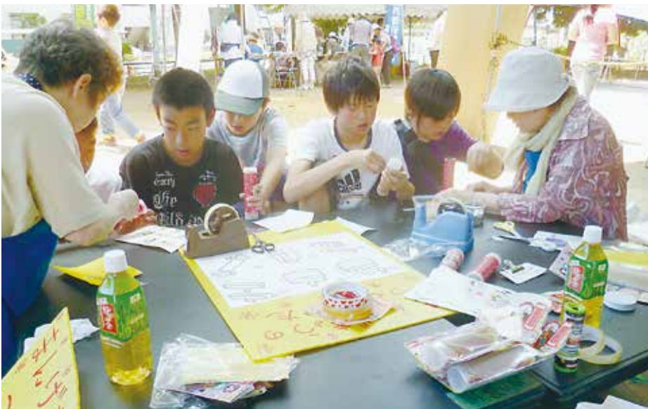
上：新企画の『万華鏡づくり』は、子ども達に大盛況 下：「子どもの広場」で青年部の巨大ゴム鉄砲で遊ぶ来場者一家

職人マップを載せたチラシ は3000枚配りました。 今回は、住宅相談が4 件もあり、仕事確保につな がりました。 なお、昨年冬と今回のカ ンパ15722円は全額