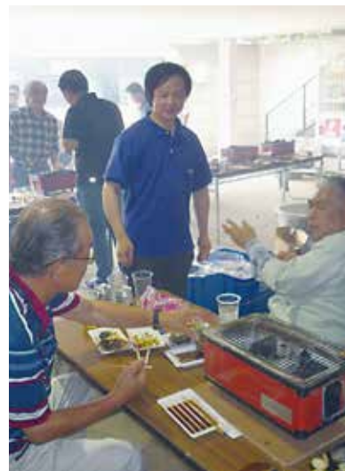
左、上: 食べて、飲んで 思い思いに交流