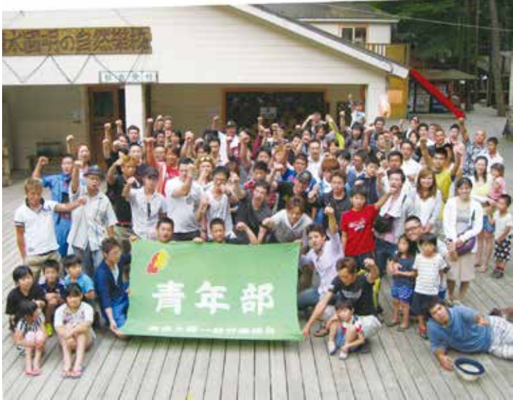
上：参加者全員が大満足 下：自分たちで、釣って、さばいて…