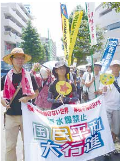
暑い中「解釈改憲反対」とデモ行進

接な関係にある他国への武力攻撃が発生し、日本の存立が脅かされ、国民の生命、自由および幸福追求の権利が根底から覆される明白な危険がある(2)日本の存立を全うし、国民を守るために他に適当な手段がない(3)必要最小限度の実力行使にとどまるー 場合の「武力の行使」は憲法上許容されるとして、集団的自衛権の行使を容認した。