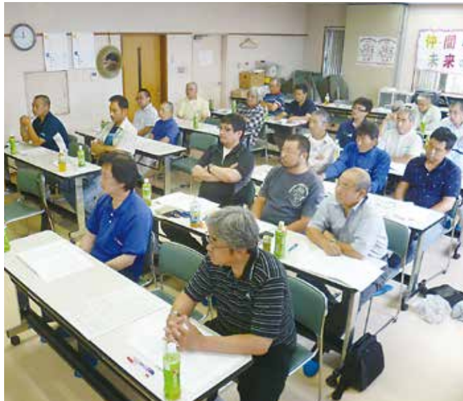
上: PAL 活動の重要性をしっかりと学習 下: 交流会を前に自然と顔がほころびます

7月6日(日)午前9時 多摩北(清瀬久留米・小平・西東京・村山大和・東村山) 午前中に学習会として、