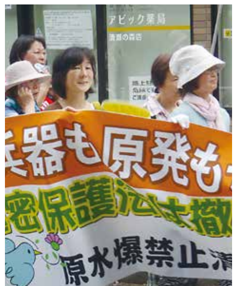
上：沿道にも横断幕でアピール 下：「青い空は」を生き生きと合唱

梅雨も明け猛暑の中朝早くから60人近くの方が集まって頂きました。朝早くから集会での各代表者の演説やエールが今日の行進のやる気に繋がりました。平和行進には初めて参加させて頂きましたが、マイクを通した訴えの時も、みんなが真剣に演説者を見、