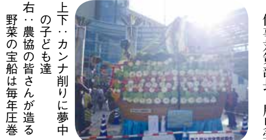
上下：カンナ削りに夢中の子ども達 右：農協の皆さんが造る野菜の宝船は毎年庄巻