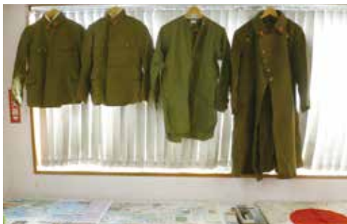
上中：支部役員の提供で、実際に使われた軍服、水筒やカバンなどの所持品、日記やメッセージの書かれた日の丸旗など貴重な資料が並ぶ。シニア友の会の役員の方々が体験を語ってくれました。

安婦は居たんだな」という思いがありました。また、軍需工場のあったところ、しょうちゅう空爆を受けていた方は、空襲があるのが普通になり、「別段怖いとは思わなかった」と語った。私の頭の中には、空襲後の市街地の被害状況確認任務の話や、その後の悲慘さに眉を顰めました。この方