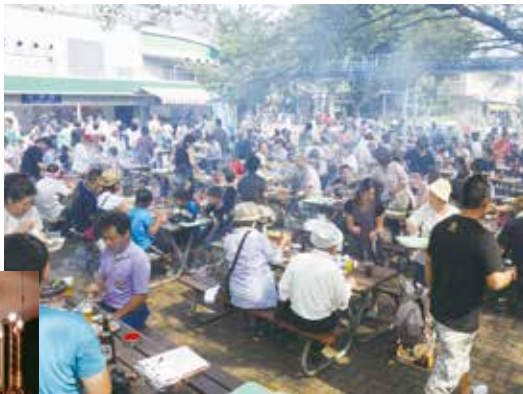
支部主催 2012年秋のとしまえんBBQの様子