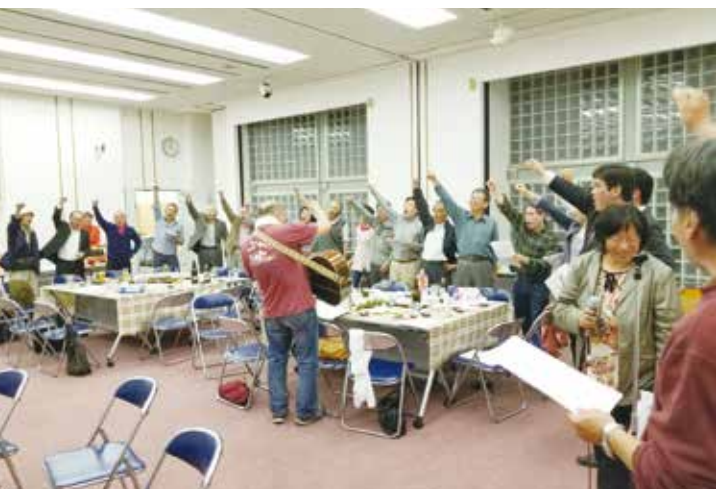
「がんばろう」の合唱で盛り上がる参加者