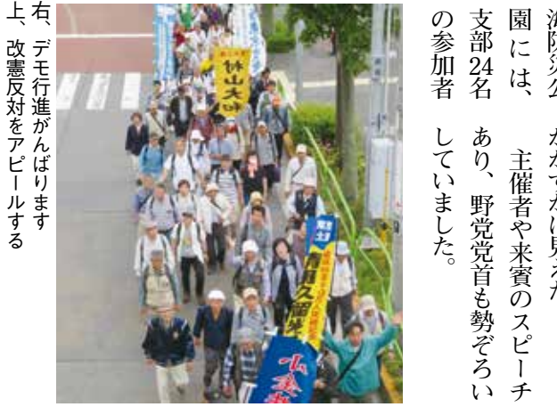
右、デモ行進がんばります 上、改憲反対をアピールする

5月3日憲法記念日、朝から降っていた雨も昼前にやみ、曇り空の下、東京臨海防災公園には、主催者や来賓のスピーチ支部24名あり、野党党首も勢ぞろいの参加者 してました。