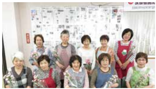
美味しいお昼を用意してくださった主婦の会のみなさん

住宅デー開催。20代初めての参加。包丁研ぎ、まな板削り：「電工の俺は何すりゃいいの？」。仕上がった包丁を拭いてくるので受付へ、単調作業故に他の人ととられた。汚れた水の取り替えや会場のごみ拾いなど時間つぶしが続かない。30代、当たり前のことですが受付人数より包丁が多