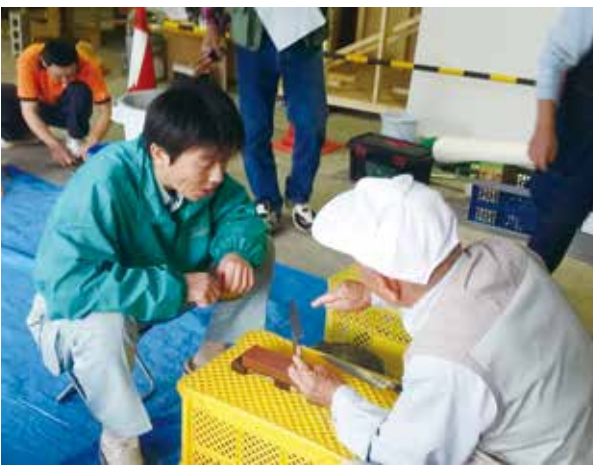
シニア友の会の仲間の指導を熱心を受ける

「前よりも切れなくなかった」：平謝り。手練れによる研ぎなおし、悔いが残った。かれこれ25年参加しています。年々包丁の本数、研ぎ手の参加も危ぶまれ、近年は子供受けするものを