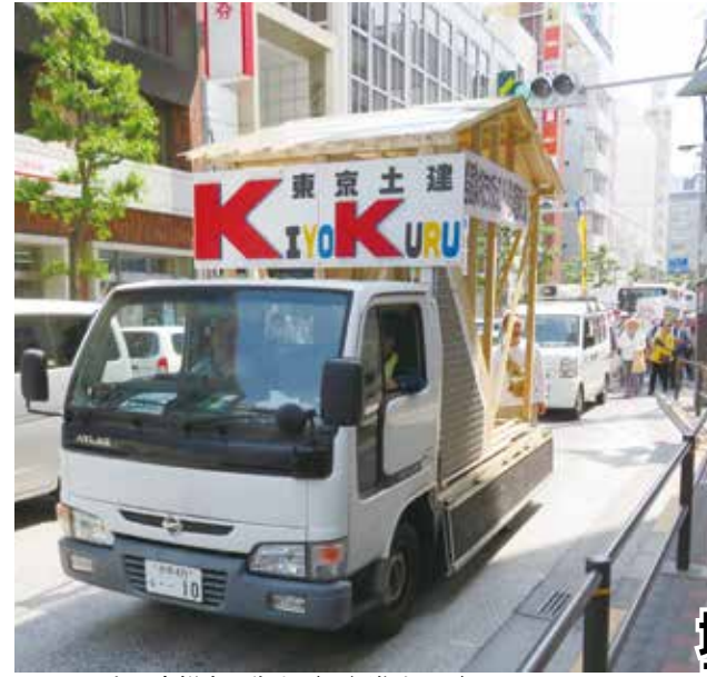
上、吉祥寺の街をデモ行進するデコカー 下、要求を掲げて準備OK

4月24日(火) 清瀬アミ 夜祭が開催されました。土 ユーホールで清瀬・東久留 建からは18人の仲間が参加 米地区労合同のメーデー前 しました。 各団体から メーデーに向 けた決意が語 られ、共にメ ーデーを盛り 上げる。前夜祭の後半はお待ちか ねの合唱です。清瀬地区労 の垣見議長のギターで、メ ーデー歌集からお馴染みの 曲を歌いました。締めくく りは「がんばろう」。 みんなで大きな 輪をつくり、腕 を組んで歌いま した。団結して この労働者で す。5月1日の 三多摩メーデー に向けて団結が より一層強くな りました。