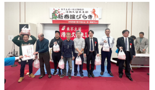
▲今年はお米が当たる抽選会

今年はお米にこだわった賞 品が用意され、こしひかり、 ゆめぴりか、パックスのご飯 などが参加者に当たり、お 米が値上がりしている事も あつて、当選者に喜んで貰 えました。