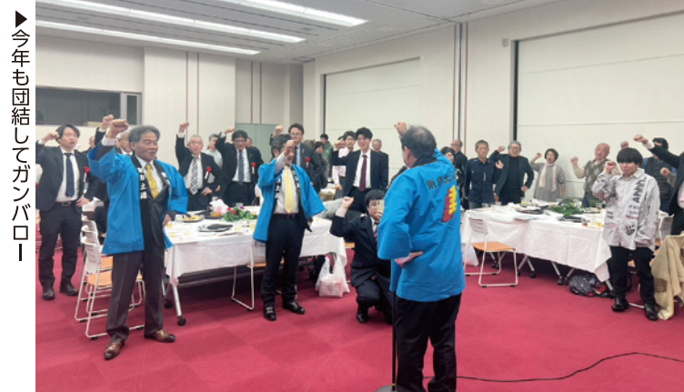
▶今年も団結してガンバロー

3月29日(日)、各分会で 一斉に分会総会を実施しま す。総会終了後、土建国保 の新年度証交付会を行いま す。マイナ保険証の利用登 録をしているかどうかによ り、保険証の代わりに提示 し病院にかかれる「資格確 認書」、マイナ保険証読み取 りエラーの際に提示が必要 な「資格情報のお知らせ」 を交付します。5年に1回 の節目健診を割引価格で &1年に1回の土建健診を 無料で受けられる健診受診 券は、総会で配られる新年 度証にしか付いていません。 土建国保加入の方は必ずご