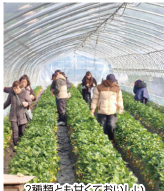
2種類とも甘くておいしいいちごでした

その後立ち寄った道の駅に栃木産のいちごが一箱2パック入りで1200円、「とちあいか」も生産者の名前入りで安く売っていました。