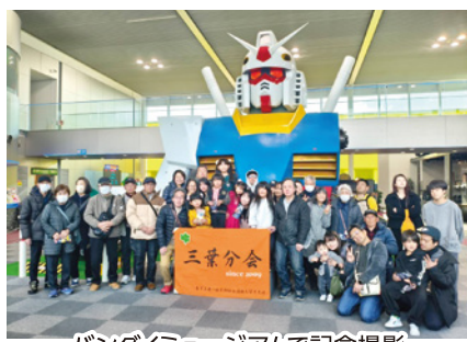
パンダイミュージアムで記念撮影

当日は天気にも恵まれ、午前中は「おもちゃのまちパンダイミュージアム」でマニアにはたまらない懐かしい展示物に興奮し、昼食も食べきれないほどの量で大満足でした。参加者は夫婦・親子・孫・ひ孫の35名でした。