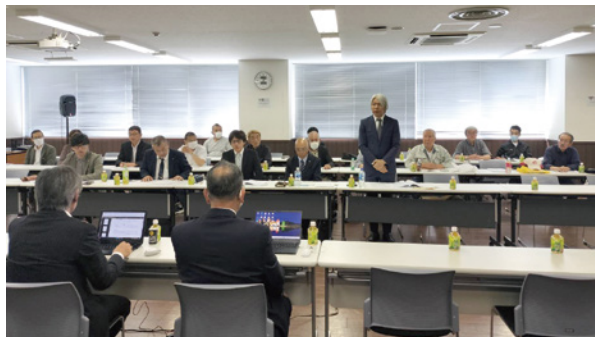
▲賃金以外にも様々な内容で交渉を行いました

5月21日（水）大手企業 交渉に交渉団として、支部 からは4人が参加しました。 今回の担当交渉先は昨春秋 に引き続き高砂熱学工業 （株）でした。 作業員への適正賃金の支 払い、CCUSのカードリー ダー全現場への設置や、レ ベルに合わせた手当の支払 い、適正工期による働き方 の改善、労災防止、特に熱 中症への対策など様々な内 容で交渉が行われました。 CCUSに関しては独自 の表彰制度を設けている事、 熱中症対策も熱中症警戒