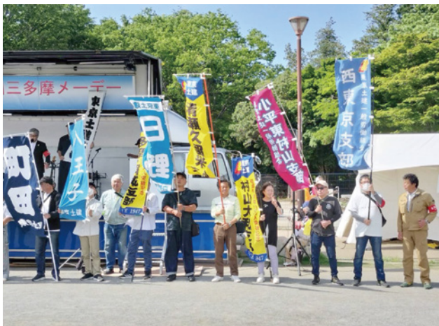
▲建設労働者の労働環境改善を目指す決意表明