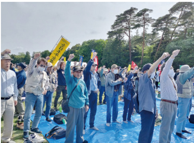
▲支部からも多くの仲間が参加して声をあげました

我々が以前から訴えてき たことは何一つとして変 わっていません。賃金にし ても30年前とほぼ同じ。そ れに対して物価はどんどん 上がって行く。30年近く賃 金が上がらないのは日本だ けと言います。人員不足や 長時間労働も同様です。 井の頭公園での集会の後 は、吉祥寺駅までパレード