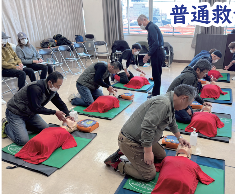
▲受講者のみなさん 真剣な表情です