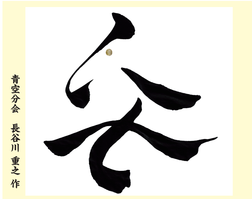
青空分会 長谷川 重之作