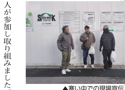
▲寒い中での現場宣伝

12月18日（金）多摩北ブロック4支部のPALの仲間で行った27階建て、商業・公共施設を含む複合施設建設現場にて年末いっせいで現場宣伝を行いました。