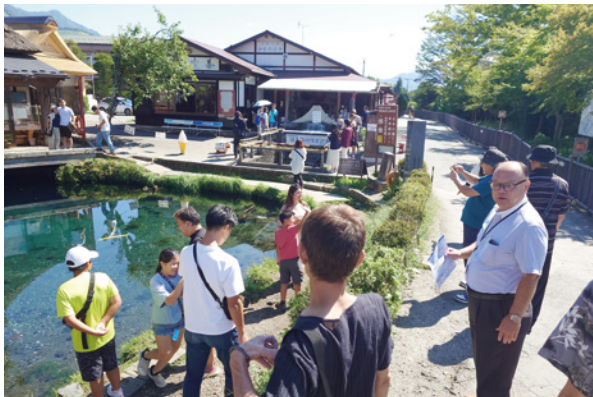
▲みんなで忍野八海を散策