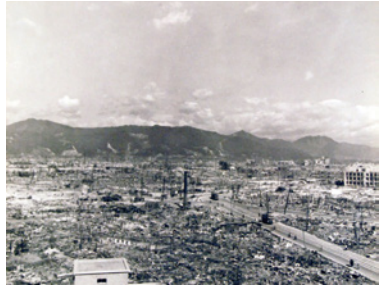
▲原爆投下後の広島市内

昭和20年代の中頃から日 本の社会全体に活気が戻っ てきました。「三種の神器」 と呼ばれたテレビ・電気冷