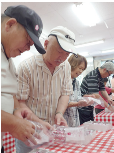
▲信玄餅の詰め放題に挑戦

今年もトイレ付き豪華バ スで初参加3家族。総勢34 名で忍野八海散策、河口湖 で昼食、見晴らし園でぶど う狩り、桔梗屋信玄餅の詰 め放題に挑戦しお土産を買 い帰路へ。