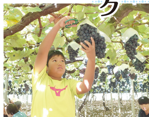
▲ぶどう狩りも楽しめました

今年もトイレ付き豪華バ スで初参加3家族。総勢34 名で忍野八海散策、河口湖 で昼食、見晴らし園でぶど う狩り、桔梗屋信玄餅の詰 め放題に挑戦しお土産を買 い帰路へ。