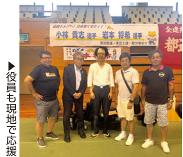
▶役員も現地で応援