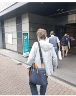
◀当日はしょうけい館も 見学しました

昭和22年(1947)教 育基本法の制定により、小 学校6年、中学校3年の9 年間の義務教育がスタート しました。小学校では給食 も始まりました。テレビの 無かったこの当時は、街角 で見る紙芝居が子どもたち にとって大きな楽しみの一 つでした。