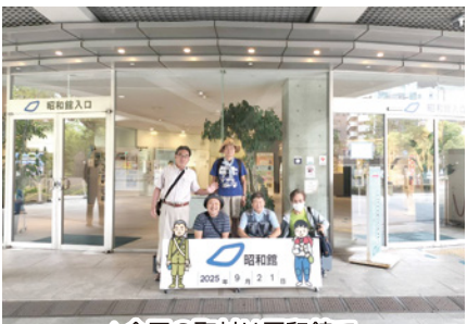
▲今回の取材は平和館で

昭和16年(1941)に、 当時の小学校は国民学校と 名前が変わり、児童を「少 年」と呼ぶようになりました。 昭和18年(1943)か らは、中学生や女学生が学 業を中断して、人手不足を 補うために兵器工場などに 勤労動員されるようになり ました。日本の本土への空 襲が予想されると、都市の 小学生は親元を離れ、地方 へ疎開することになりました。 昭和19年(1944)に なると、アメリカ軍の飛行 機が日本の各都市へ爆弾を 落とすようになりました。 昭和20年(1945)3月 10日未明、東京は大きな空 襲を受け、多くの市民の命 が奪われました。さらに広 島と長崎に原子爆弾が投下 されました。これは人類が 考え出した最も残酷な兵器 (核兵器)でした。