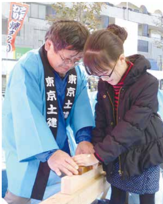
ベテラン組合員が子どもと一緒に鉋を引く

手渡すと、「かつお節みたい」「いいにおい」と声が上がります。「いいダシ出るよ!」「お風呂へ入れて今日は温泉気分だね」とお土産に持たせると、「ありがとう」と言ってお父さんやお母さんに見せながら、笑顔で帰っていききました。