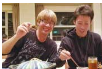
宴会場にて 左が西部分会長

まずは一日目。曇り空の中、集合時間の6時30分頃着いた。数人の組合員と一緒に出発の準備をしながら、浮かれる気持ちを抑え、皆を待っている。一人の組合員が以前のバス旅行で使っていた集合場所にいるのを見て、通りかかった他の仲間が発見し無事合流したり、入院しているはずの組合員から電話が鳴り、電話に出ると、他の参加者から