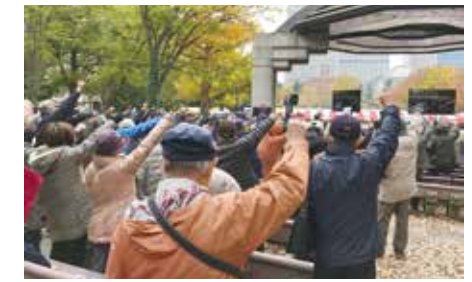
モニター前で全国の仲間と「ガンバロー」

決起集会には、ほぼ全ての政党が参加され、あいさつを頂いています。どの政党のあいさつも、建設国保を守り育成する、という様な内容です。しかし、社会保障費を抑え、消費税を上げ続け、法人税を下げ、高所得者の税率を下げ、ムダな大型公共工事を増やし、防衛費を増やし続けてきたのは、政権与党です。 集会、ハガキ要請などの運動だけでは、限界がある