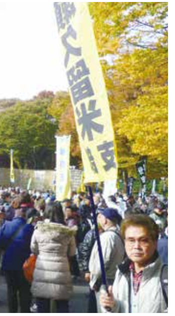
快晴の日比谷公園に集まった全国の仲間がデモ行進に出発した

全建総連主催の建設国保への予算要求集会。年に二度行われている。11月22日(水)、今年2度目の集会が行われました。全国から約5200人の参加。 私が組合に入ったのは、1982年、25歳の時でした。