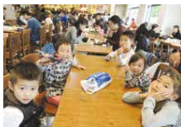
「ご飯まだかな〜」アウトレットの食堂で

11月19日(日)に行われた首都圏建設アスベスト原告団交流会は、西東京支部と村山大和支部との3支部合同で行われました。各支部の参加された原告・組合員の皆さんありがとうございました。全体で17人(原告1人、原告の家族一人、組合員12人、書記3人)の参加でした。 一人親方も『労働者』 首都圏建設アスベスト原告団交流会 障の対象外でしたが、今回の判決で「必ずしも労務提供の法形式にとらわれることなく、指揮監督下の労働を勝ち取るために、運動をさらに前進させていきたいと思われました。 参加した仲間から、アスベスト被害根絶を求め、熱い訴えを聞かされた。