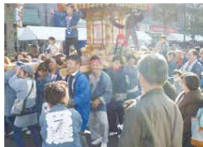
上: 組合の仲間も元気いっぱい担ぎます 下: 子ども達もチラシ配布のお手伝い

まず先生のお手本を見ます。そして自分でやってみます。当然ですがカンナは進みません。ベテラン組合員さんが手を添えて引き