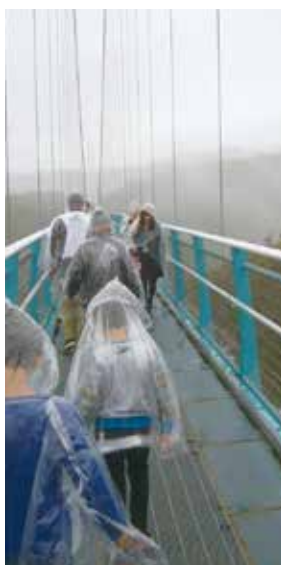
どしゃ降りの中雨合羽を着て日本一の吊り橋を渡った

全長400メートルの日本一長い吊り橋がある。富士山や駿河湾などの絶景が一望できる場所。しかし、台風の影響でどしゃ降り、絶景を楽しむどころではない。子供を含め18人が吊り橋を渡るも、ズボンや靴はびちゃびちゃとなり、バスの中では着替えの時間を設ける事となる。