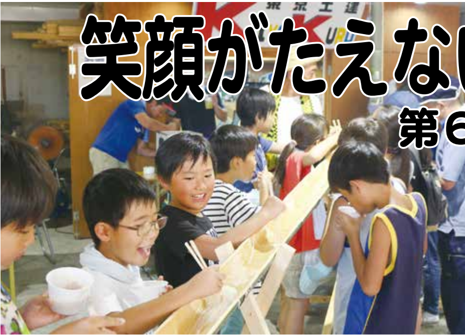
上、竹のレーンを流れるそうめんに大喜びの子どもたち 下、今年は入口側に移動した焼きものコーナー