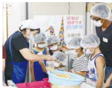
味噌づくり、うどん作りに興味津々です

暑い暑い8月5日(日)、清瀬久留米支部の恒例行事となった流しそうめん交流会が開催されました。暑さも吹き飛ばし148人が参加し一日楽しく交流しました。実行委員会を中心に、シニア、今年初めて実施した「手