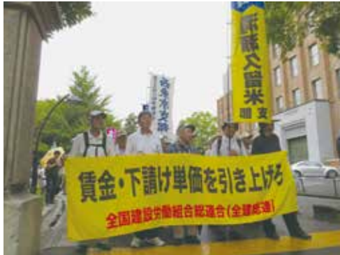
「建設国保を守れ」と声を上げる支部の仲間