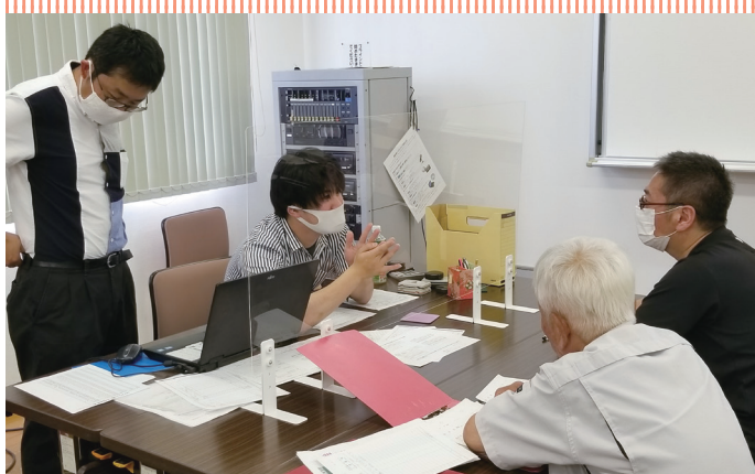
清瀬アミューで行われたなんでも相談会