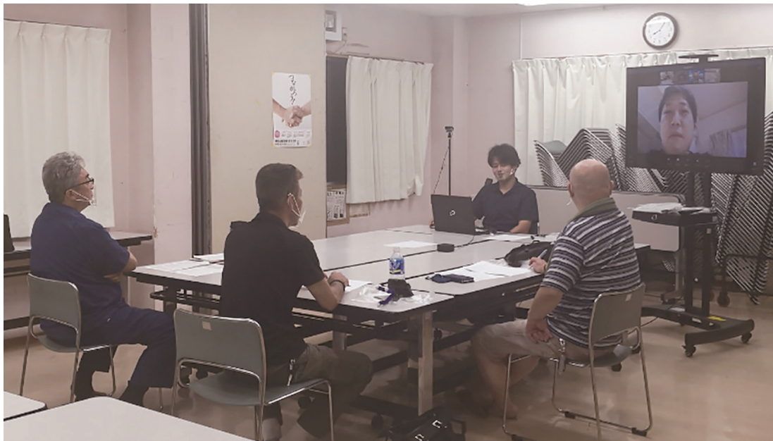
支部初のオンライン専門部会を開催した税金経営対策部