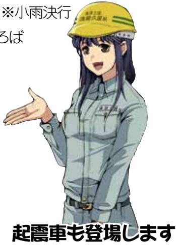
起震車も登場します

上棟式、建設重機体験、模擬店、ステージパフォーマンス、消防車登場します！他にも楽しい企画盛りだくさん。