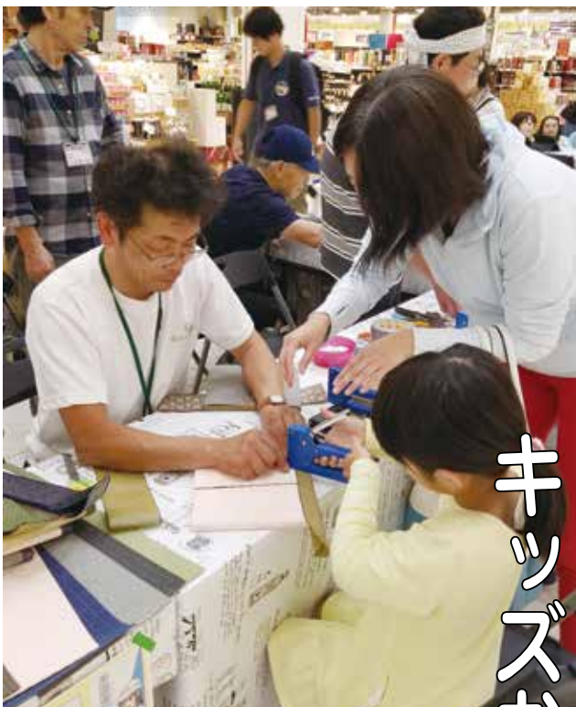
慣れないタッカーを使ってミニ畳を作る体験者

おだやかな一日でした。三葉分会では7人が東久留米駅で合流して電車に乗り込みました。ちよつと混み合っていました。先に乗車していた女性が席を立ち「どうぞ」と声を掛けてくださいました。私はびつくりしましたが、杖を持つていたから気を遣ってくださったのだとわかり、「あら、すみません、ありがとうございます」と遠慮なく席に着きました。いよいよ白いシンフォニーが待っている日の出棧橋に着き、乗船してランチの席に着くと、すでにバイキング料理が用意されていて、早速担当から説明を受けて、器を持って料理選びに何度も廻りながら他の皆の顔を見ると、ニコニコでした。気が付くと船はすでに動き出していて、「あらずい分静かねー」と窓から海を見たら、波はおだやかなさざ波です。何分過ぎたのかわからなかったですが、シンフォニーは、東京湾の中のハートラインをクルージングして行きました。これが私には特に嬉しい体験でした。広い海に船や長い橋、羽田空港、めずらしい船等と風景を楽しんでいるうちに、あつという間にランチタイムは終わりになりました。その後築地の場外市場を見学し、好きなものを買いて帰って楽しんだ一日でした。