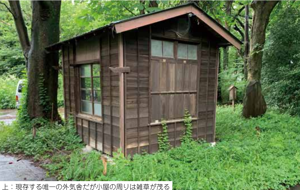
上：現存する唯一の外気舎だが小屋の周りは雑草が茂る