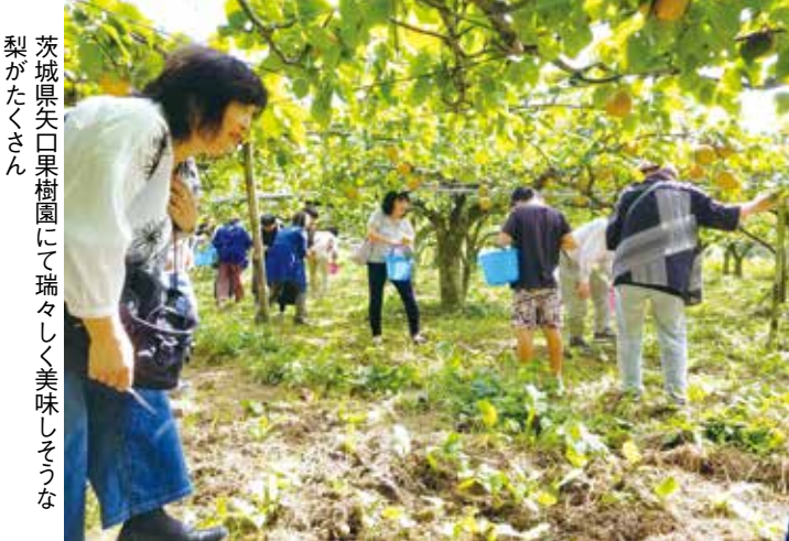
茨城県天口果樹園にて瑞々しく美味しそうな梨がたくさん