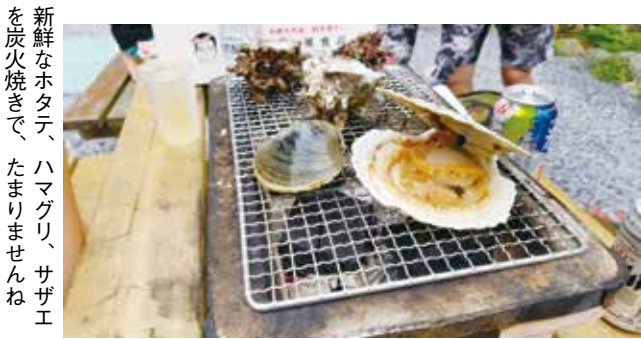
新鮮なホタテ、ハマグリ、サザエを炭火焼きで、たまりませんね