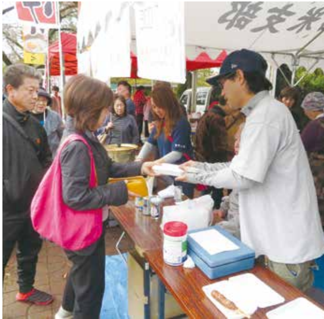
右 みんなで協力して運営した土建コーナー 下 木工教室体験者にやさしく指導する

7月16日 入社して1年間で、幸いにもこの仕事に就くことが出来ました。 福岡で生まれて東京の町田で育ちました。年齢は34歳です。高校を卒業後どう でも海外に行きたくて18歳の時に1年間カナダに行き、アルバイトをした。知識も経験もない私に の役に立って仕事をした。い てとずっと考えておりました。 組合員の皆様と教 えてくださり、いつも非 常にありがた気持ちで います。