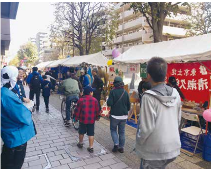
右奥 普段は使わない「かなな」に悪戦苦闘(清瀬) 右、天気にも恵まれた皆さんの来場者で賑わった(東久留米)