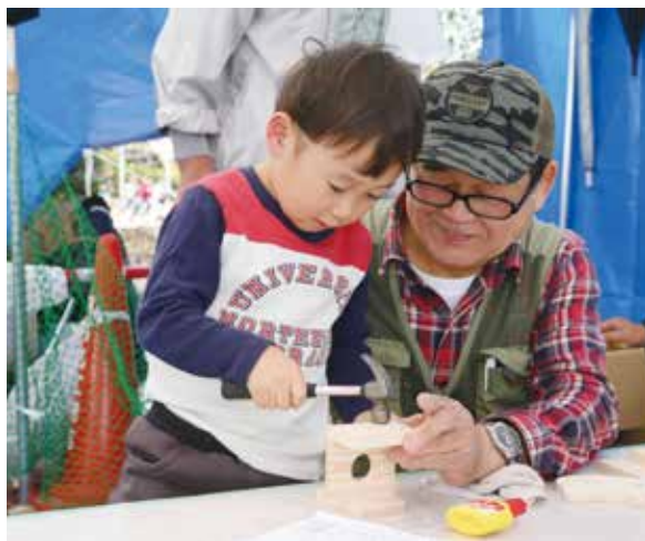
11月24日 (日) 清瀬中央公園にて、第13回平和と健康まつりが開催されました。当日、朝まで雨の降る中、例年より規模を縮小しての開催となりましたが、それが逆に功を奏し模擬店