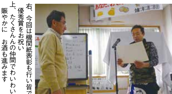
右、今回は機関紙表彰も行い皆で優秀賞をお祝い、たくさん仲間でわいわい賑やかに お酒も進みます