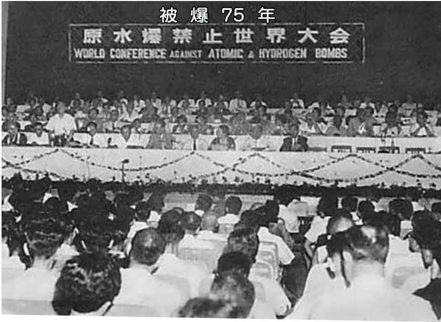
上、1955年8月6日に開催された第1回原水爆禁止世界大会 下、2007年の平和行進のようす