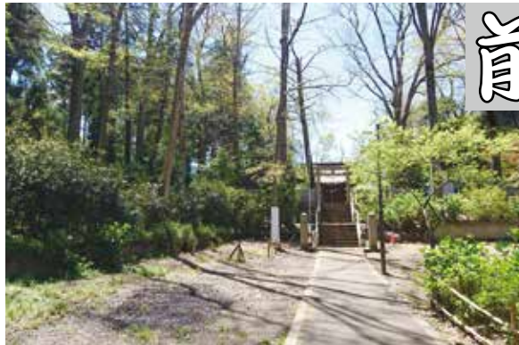
神社天宮柳 緑地の中で自然豊かな場所にある柳窪神社。上、山つつじ ホームページ掲載時はカラーで見られます