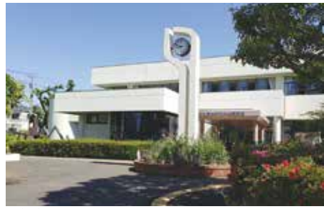
改修工事をしている東久留米中央図書館

10月7日東久留米市中 央図書館の改修工事現場へ 訪問をしてきました。今回 の現場訪問は全国労働衛生 週間(10月1日~7日)に 合わせ、現場の労働、衛生 環境や、対策についての話 を聞く懇談を目的として実 施されました。