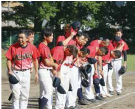
下：2回戦を勝利で飾りました