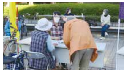
最近行った工事の相談にいらっしました

10月25日(日)に東久留米市役所前広場にて、東久留米社会保険推進協議会主催の青空なんでも相談会が行われました。年金、子育ての相談などの身近なものから、税金、経営に関するもの、法律相談などの専門的な相談も内容にブースを分けて相談を受けました。支部として住宅に