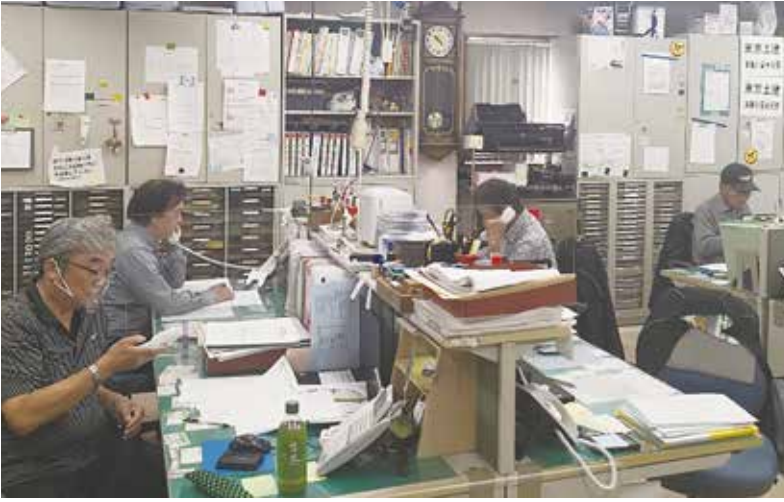
新型コロナウイルスの影響でお困りの事ないですか？と電話かけをする三葉分会役員