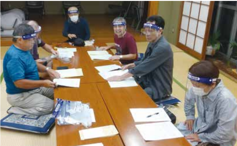
南町分会はフェイスシールド着用で会議を実施