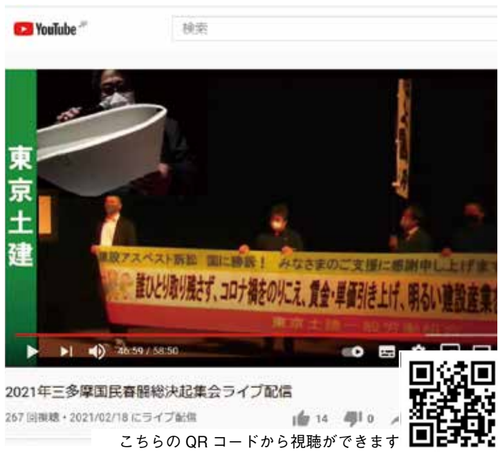
こちらのQRコードから視聴ができます

三多摩国民春闘勝利総決起集会が2月18日(木)に、リアル会場としてライブ配信が2月18日(木)に、リアル会場としてライブ