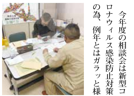
上：一人ひとりの思いを 置き去りにしない相談会を目指します

まず初めに日頃より税金 経営対策部の運営、運動に 御理解、御協力をいただき 誠に有難うございます。 今年度の相談会は新型コロナ ウイルス感染防止対策 の為、例年とはガラッと様 子の違う相談会となりました。 待ち時間による密を避け るため完全予約制を取ら せていただきました。相談 時間も短縮する為に事前の とりまとめ等もお願いし、 例年よりスムーズな相談会 に出来たのではないかと思 います。皆様には感謝 申し上げます。 仕事柄休みが不定期で直 前に休みが決まる組合員さ んも多いためですが、皆 さんきちんと予約を取り、 時間通り来所いただき有難 うございました。不十分な 点は、待ち時間も少なくプ ライバシー保護の観点から も良かった事に気づかされ ました。また、相談員側の 立場としても例年大勢の人 が待っているという焦りが 少なく落ち着いて入力作業 が出来たと思います。 限られた時間で、確定申 告に特化した相談会では有 りませんが、今回頂いた御意 見を参考にし、皆さん一人 一人の思いを置き去りにし ない相談会を目指して努力 を続けて行きたいと思いま す。