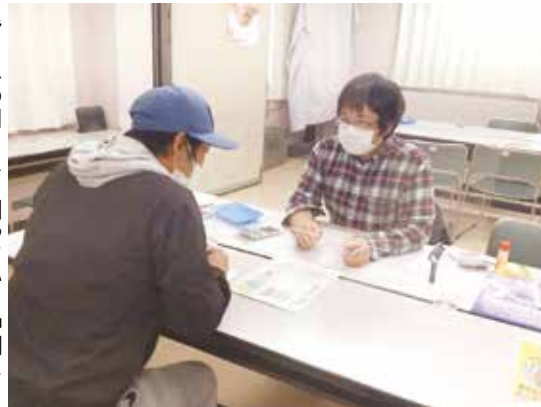
皆さんの周りにも困っている仲間はいませんか？

昨年からの活動自粛でなかなか皆さんと顔を合わせる機会がなく、寂しいですが、毎月のお知らせを郵送していますので、そちらを是非確認してください。また、緊急事態宣言が明けても社会不安がなかなか拭えませんが、仕事や暮らしで困りのことは遠慮なく支部事務所へお