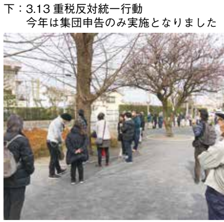
下：3.13 重税反対統一行動 今年は集団申告のみ実施となりました