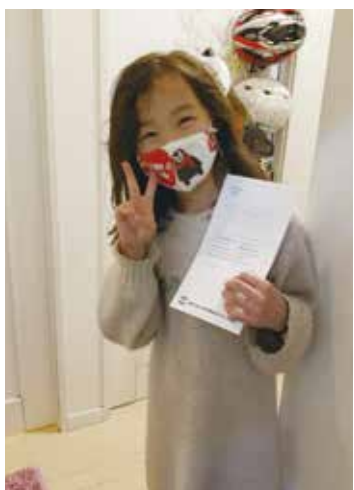
新入学おめでとうございませすお勉強頑張ってくださいね

毎年3月から4月にかけては、新入学祝い金の声掛けが盛んに行われたため申請件数もグンと伸びます。今回、新入学祝い金の図書カードのお渡しを兼ねた組合員訪問行動を行いました。