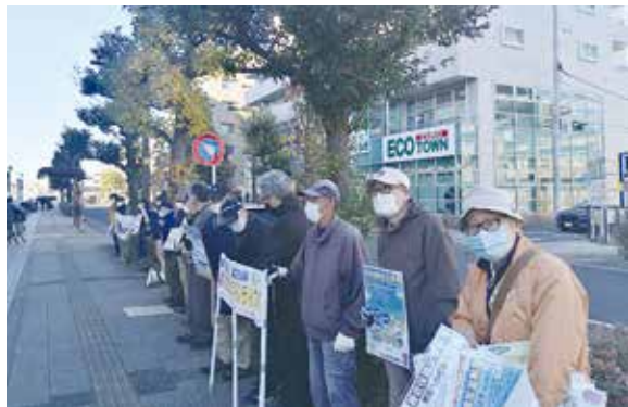
プラカードを持ち皆でアピール

11月28日(日)に開催された東久留米市民スタンディングは、毎年春と秋に2回行われてきた市民大集会の2年ぶりの開催でした。東久留米地区労と社保協を声掛け人として、様々な団