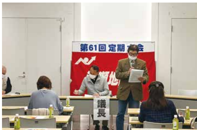
東京土建の活動報告をする尾芦副議長