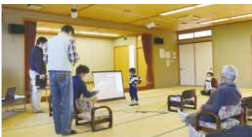
会場のお子さんもリモートに興味津々

をいたしました。ZOOM を使ったビンゴゲームなので少々難しいかとも思いましたが、事務局さんの多大なご協力と予想を上回る組合員さんの参加があり、概ね成功だったのではないかと思います。「分会の皆さんへの還元」をお題目に「リモート」の繋がりが取れる