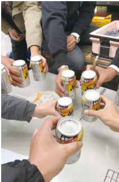
久しぶりに皆で乾杯!!

新型コロナウイルスの感染が落ち着き始めた10月31日(日)、自粛していた活動再開の第一弾として、新入部員歓迎 BBQ 交流会を滝山公園で開催しました。 当日は不安定な天候にもかかわらず、新入部員家族を