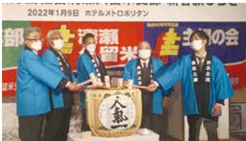
呼吸を合わせての鏡開き

2021年5月の建設アスベスト訴訟第1陣の最高裁判決を受け、裁判をせずに国からの賠償として給付金を受けとる事の出来る「建設アスベスト給付金法」が1月19日に施行され申請受付が開始しました。