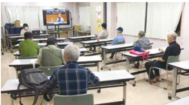
昨年行われた憲法学習会

対策を万全に行います。参加を希望される方は2月に配布予定のお知らせをご覧ください。 【とき】 3月12日(土) 午前10時より 【ところ】 支部会館 主婦の会カトレア