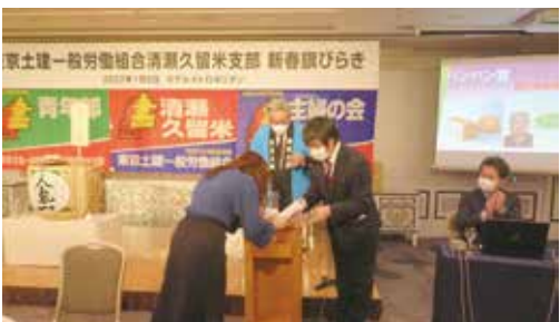
お楽しみ抽選会も大変盛り上がりしました