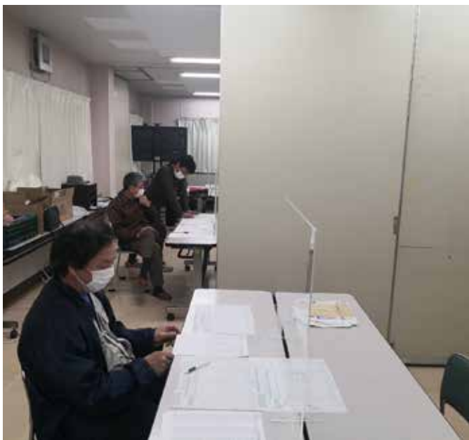
群ごとに仕切った、三葉分会の合同群会議

でした。群長を長く担っていた仲間が引退したことで役員が不足しています。群会計から参加した仲間群役員への協力を呼びかけました。丁寧に説明を受けた仲間が前向きに検討してくれています。