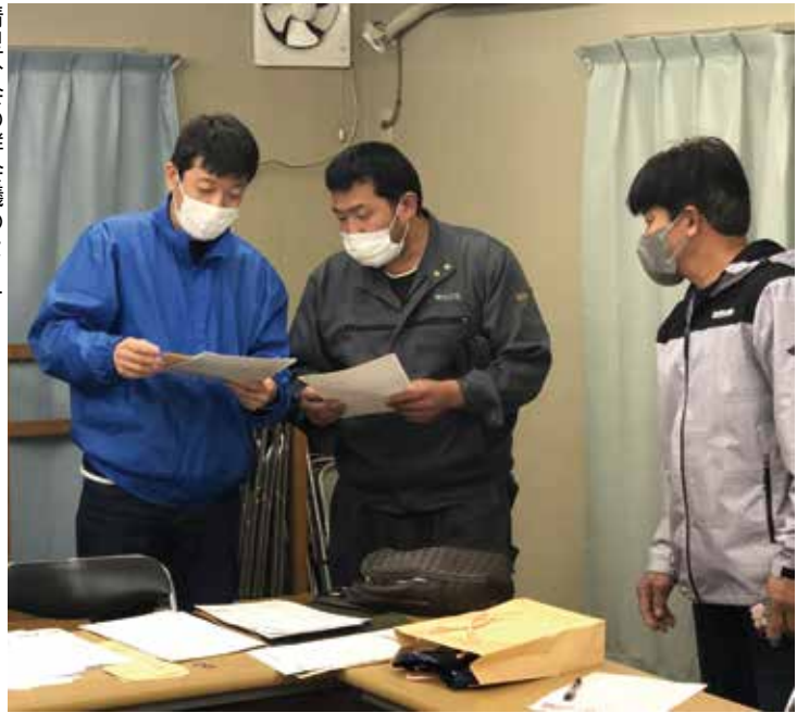
清里分会の群会議の様子

分会・群の運動の基幹となる群会議が対面で再開しました。まだまだコロナ禍の中、十分な話し合いもできませんが、群会議こそ東京土建の基礎組織です。仲間が協力して作り上げる群会議開催に向けて、皆さんの協力をお願いします。