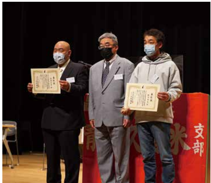
表彰を受ける、徳武社保対部長(左)と橋口青空分会長(右)