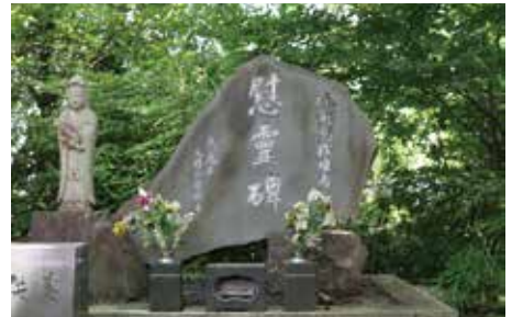
硫黄島の島の形を模した戦没者慰霊碑

高尾山に、数々の戦没者慰霊碑があることを初めて知りました。私は島の形をした、硫黄島の慰霊碑が目