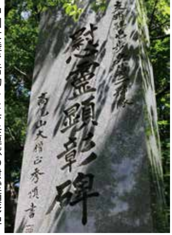
中国大陸で活動した歩兵連隊の慰霊顕彰碑

都心から近く、多くの登山客が訪れる高尾山。この山に、かつて戦火の時代を生き延びた人々の慰霊碑が建てられています。今回、その詳細を知ることができ、現地向かいました。高尾山のケールカーを降り、頂上へ向かって歩いていくと、登山道は途中で「男坂」と、「女坂」の二つに分かれます。この分岐を男坂へ進み、石段を上ると右手に「苦抜け門 三密の道」の石門があり、これを進んでいくと、正面に「佛舍利奉安塔」と呼ばれる白い塔が、そして右側一帯に慰霊碑が並んでいます。硫黄島戦没者、中国に駐屯した陸軍部隊、シベリア抑留者、満州に渡った林業関係者が建立の決め手になったようです。