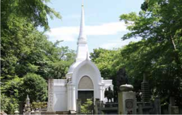
タイから贈られた仏舎利奉安塔。この裏側に慰霊碑がある