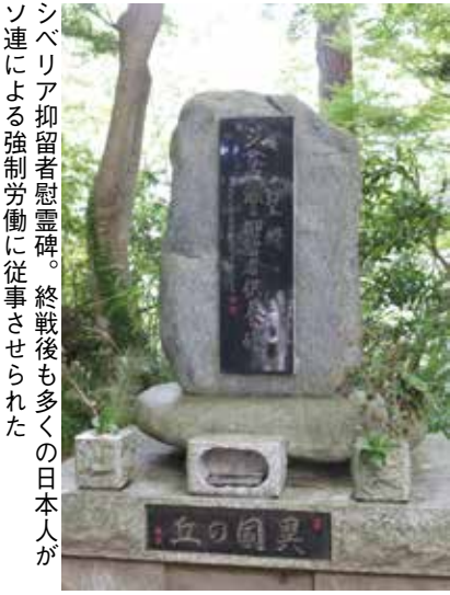
シベリア抑留者慰霊碑。終戦後も多くの日本人がソ連による強制労働に従事させられた

都心から近く、多くの登山客が訪れる高尾山。この山に、かつて戦火の時代を生き延びた人々の慰霊碑が建てられています。今回、その詳細を知ることができ、現地向かいました。高尾山のケールカーを降り、頂上へ向かって歩いていくと、登山道は途中で「男坂」と、「女坂」の二つに分かれます。この分岐を男坂へ進み、石段を上ると右手に「苦抜け門 三密の道」の石門があり、これを進んでいくと、正面に「佛舍利奉安塔」と呼ばれる白い塔が、そして右側一帯に慰霊碑が並んでいます。硫黄島戦没者、中国に駐屯した陸軍部隊、シベリア抑留者、満州に渡った林業関係者が建立の決め手になったようです。