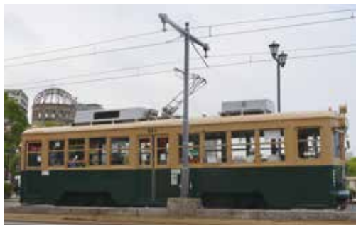
原爆ドームと被爆電車

3日目の朝、原爆ドームに近く、投下目標となった相生橋で77年目の時刻を迎えた。直前、デモを行っており、それに対し通行人が