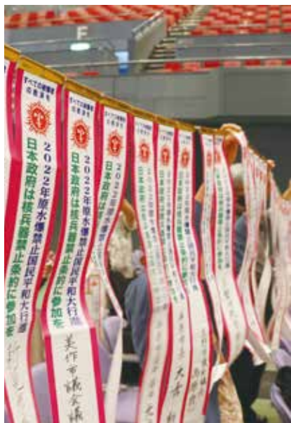
多くの自治体から、核兵器禁止条約を求める声が集まりました