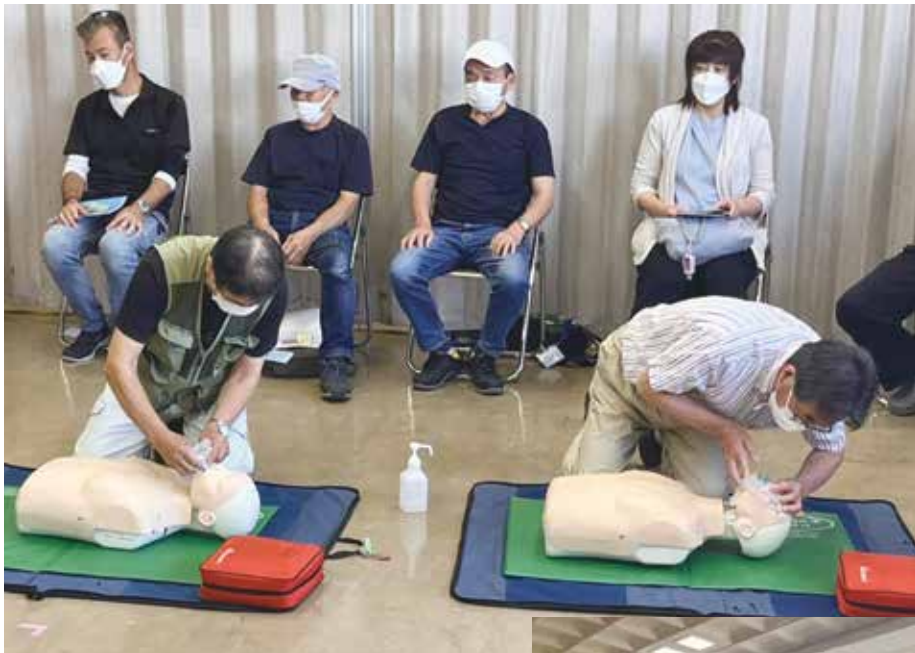
左…胸骨圧迫をはじめ、救助の流れを再確認 下…講師の話に耳を傾ける受講者のみなさん

9月11日(日)、支部チ ームNAMAZUの取り 組みである、普通救命講習 が東久留米消防署にて開催 されました。15人の参加で うち新規の人が2名、女性 も3名でした。 前回の開催から3年の経 過ということで、救命処置 の手順などは忘れてしま がち。それも含め講話に耳 を傾けていました。