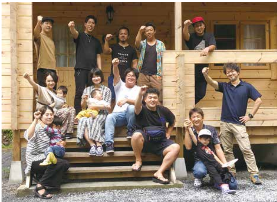
キャンプ場で3年ぶりの集合写真を撮りました

9月18日、19日（日・祝）、感染が拡大して以降3年ぶりの一泊交流を、奥多摩にあるアメリカキャンプ村で行いました。支部からは4人、全体で16人が参加しました。当日は台風接近の影響で一日雨でしたが、キャンプ場には屋根付きの焼き場があり、それぞれが持ち寄った食材を調理して、バーベキューを楽しみました。 美味しい食事とお酒で次第に会話も弾み、昼に始まったバーベキューもあつという間に日が落ちて、気が付けば日付が変わっていました。それでも交流は続きます。三年 9月18日、19日（日・祝）、感染が拡大して以降3年ぶりの一泊交流を、奥多摩にあるアメリカキャンプ村で行いました。支部からは4人、全体で16人が参加しました。当日は台風接近の影響で一日雨でしたが、キャンプ場には屋根付きの焼き場があり、それぞれが持ち寄った食材を調理して、バーベキューを楽しみました。 美味しい食事とお酒で次第に会話も弾み、昼に始まったバーベキューもあつという間に日が落ちて、気が付けば日付が変わっていました。それでも交流は続きます。三年