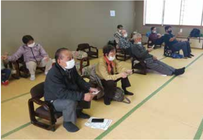
一抜けは誰なのか。緊張の一瞬

去る10月30日(日)に第二回ビンゴ大会を実施いたしました。当日には現地での参加が15人、WEBでの参加が7人で、初参加の