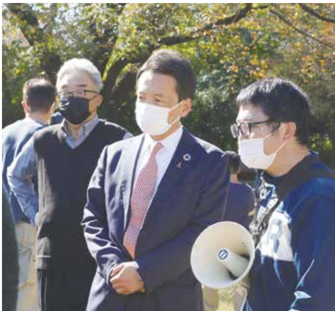
上：重機体験の様子。参加者の目は真剣そのもの 中：澁谷市長（写真中央）も会場を視察 右：子どもたちでにぎわった工作教室

清里分会は重機体験でシヨベルカーのパーツを替え薪をつかみ移動させる東京土建ならではの体験だったと思います。