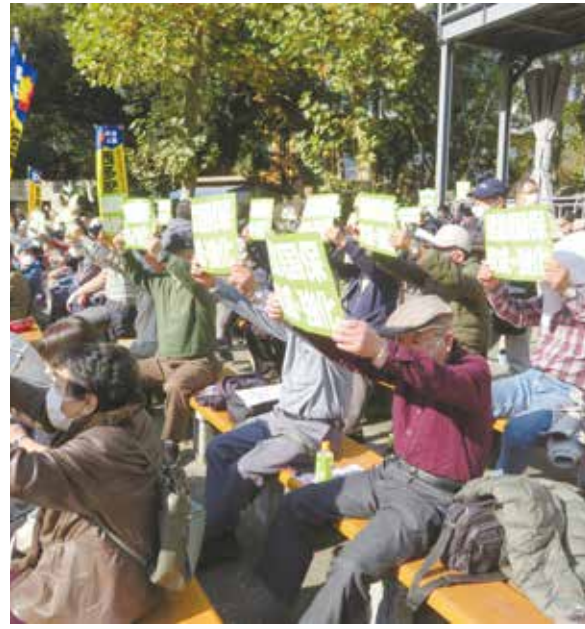
プラカードを掲げて意思統一