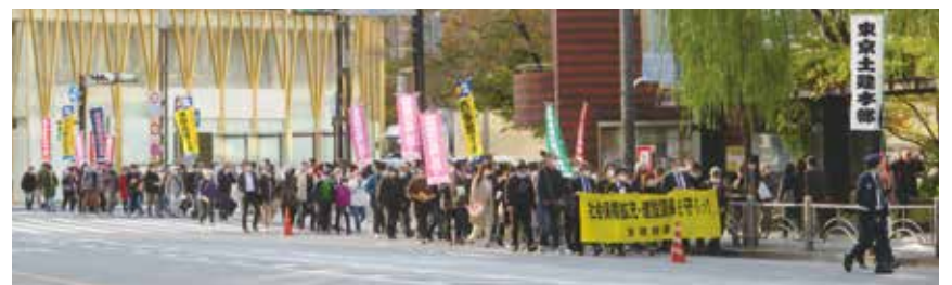
梯団は数寄屋橋交差点を通過

午前中は、東京都庁へへの要請行動です。都費補助を減らさないよう、東京土建をはじめとする建設組合が一丸となつて訴えを行いました。午後は日比谷公園に移