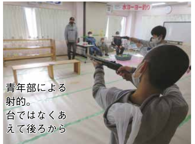
青年部による射的。台ではなくあらえて後ろから

11 月 27 日（日）、120 人を超える組合員、家族が参加し、肌寒さを感じる中、3 年ぶりの餅つき交流会を支部会館で楽しみました。 餅つきは計 7 回。まず、蒸しあがったもち米をつぶす。この作業が中々大変で、男手 2 ～ 3 人でこね上げていきます。その後いよいよ杵でついていきま す。「ヨイシヨ、ヨイシヨ」の掛け声とともにリズム良く餅をつきま す。子ども達も普段体験できない餅つきに目をキラキラ輝かせていました。 他にも焼き鳥やフランクフルト、フライドポテト、豚汁などを準備し、参加者にも好評でした。また、3 階に射的場や輪投げ、水ヨーヨーなどの子どもが楽しめるコーナーを設置し、子ども達を退屈させないための工夫もあり、参加者が一日滞在できる企画となりました。 餅つきは季節を感じるこ とができる日本の伝統文化です。このような行事を継続して行けるよう、次年度も取り組みます。運営に協力してくださいました役員