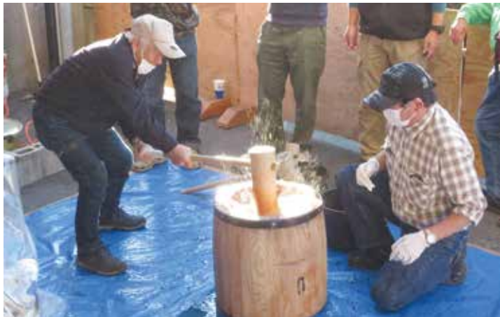
笹下シニア友の会会長による渾身の一振り。返し手は尾芦副委員

11 月 27 日（日）、120 人を超える組合員、家族が参加し、肌寒さを感じる中、3 年ぶりの餅つき交流会を支部会館で楽しみました。 餅つきは計 7 回。まず、蒸しあがったもち米をつぶす。この作業が中々大変で、男手 2 ～ 3 人でこね上げていきます。その後いよいよ杵でついていきま す。「ヨイシヨ、ヨイシヨ」の掛け声とともにリズム良く餅をつきま す。子ども達も普段体験できない餅つきに目をキラキラ輝かせていました。 他にも焼き鳥やフランクフルト、フライドポテト、豚汁などを準備し、参加者にも好評でした。また、3 階に射的場や輪投げ、水ヨーヨーなどの子どもが楽しめるコーナーを設置し、子ども達を退屈させないための工夫もあり、参加者が一日滞在できる企画となりました。 餅つきは季節を感じるこ とができる日本の伝統文化です。このような行事を継続して行けるよう、次年度も取り組みます。運営に協力してくださいました役員