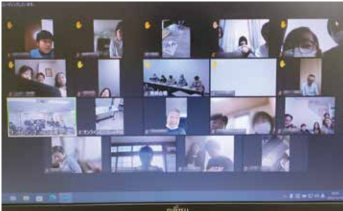
WEB参加者も準備はバッチリ！これからビンゴに挑みます

11 月 13 日 センターにリアル参加会場（日）、主婦の会 カトレア主催で は初めてとな る、ZOOM ミーティングを 用いたオンライン 併用のビンゴ 大会を開催し ました。 オンラインで 参加できない方 のために、支部 会館と清瀬市の 中清戸地域市民