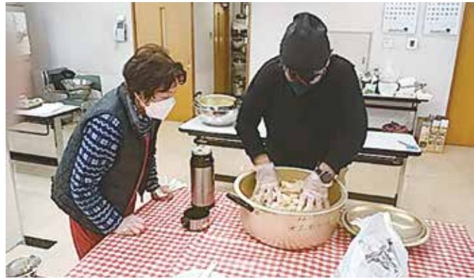
煮た大豆に塩と麴を入れてこねる作業。みそ作りの経験もあり、慣れた手つき

1月28日(土)に12人の参加で実施しました。今年も初心者向けの『手ぶらで体験コース』を用意して参加を募集しました。『手ぶら体験』には3組5人が参加しました。午前中は材料持参で3人が参加、仕込み経験もあるので作業はスムーズに進みました。午後には『手ぶら体験』の参加者に指導する時間です。すり潰した大豆と塩麹を混ぜる作業の大変さを感じながら楽しんでいました。参加者からは「こんなに簡単にお味噌が仕込めるなんてビックリしました」、「また来年も参加したい」との感想も寄せられました。初参加の方に「去年もチャレンジを見て手作り味噌仕込みに参加したいと思っていました。この場所に来る勇氣ありませんでした。今日は思い切って申し込んで本当に良かった」と言われたことが印象的でした。今年も『寒仕込み』ができたので、きつと美味しい味噌が出来ると期待しています。来年もまた新しい参加者を迎えます。