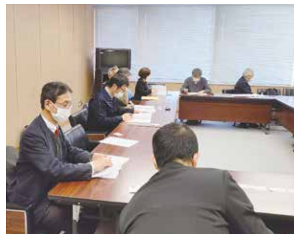
東久留米市の担当者と政策について意見交換

東京春闘共闘会議が主催する第19回自治体キャラバンが清瀬市、東久留米市で行われ、支部から両市あわせて5人が参加しました。