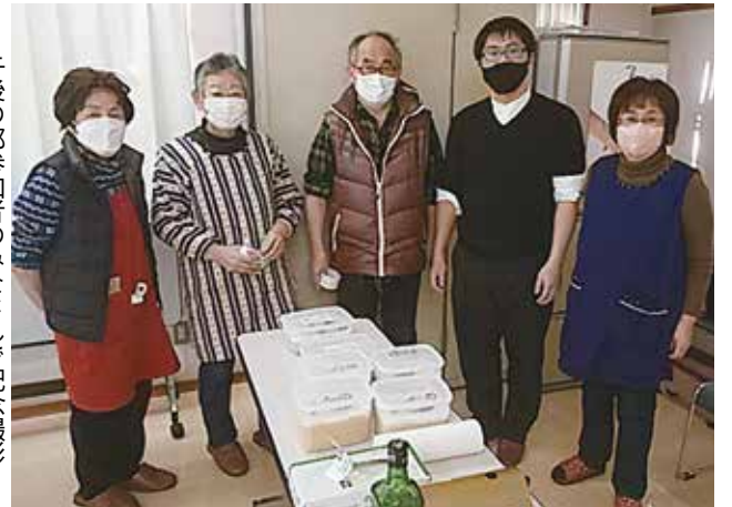
午後の部参加者のみなさんと記念撮影

1月28日(土)に12人の参加で実施しました。今年も初心者向けの『手ぶらで体験コース』を用意して参加を募集しました。『手ぶら体験』には3組5人が参加しました。午前中は材料持参で3人が参加、仕込み経験もあるので作業はスムーズに進みました。午後には『手ぶら体験』の参加者に指導する時間です。すり潰した大豆と塩麹を混ぜる作業の大変さを感じながら楽しんでいました。参加者からは「こんなに簡単にお味噌が仕込めるなんてビックリしました」、「また来年も参加したい」との感想も寄せられました。初参加の方に「去年もチャレンジを見て手作り味噌仕込みに参加したいと思っていました。この場所に来る勇氣ありませんでした。今日は思い切って申し込んで本当に良かった」と言われたことが印象的でした。今年も『寒仕込み』ができたので、きつと美味しい味噌が出来ると期待しています。来年もまた新しい参加者を迎えます。