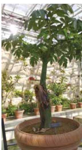
神代植物公園のシヨクダイオオコンニャク。数年に一回しか咲かない珍しい花

まずは電車で隣のひばりヶ丘駅へ。南口より「三鷹駅」バスに乗車、車中は小声で近況など話しながら三鷹駅着。南口へ移動し、「調布駅」に乗って神代植物公園へ。寒牡丹の赤、白、黄等の可憐な花に迎えられる。