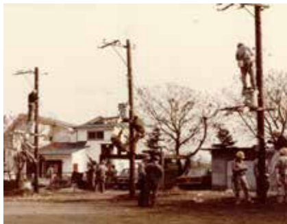
実習のようす。木製の電柱に登っての作業