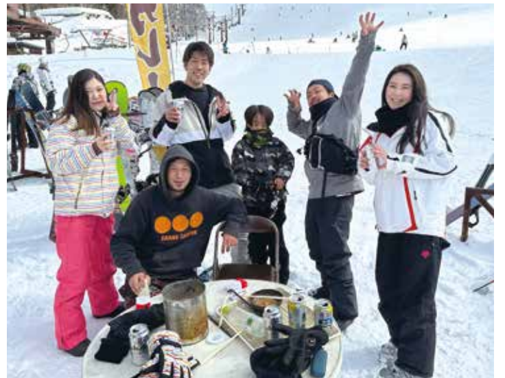
スキー場でも仲間との交流は欠かせません