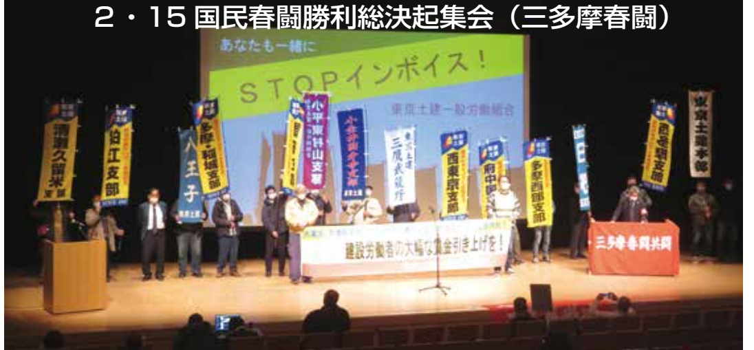
全支部の仲間がのぼり旗をもってアピール

2月15日に小金井宮地楽器ホールにて開催され、全体で211人、支部から9人が参加しました。