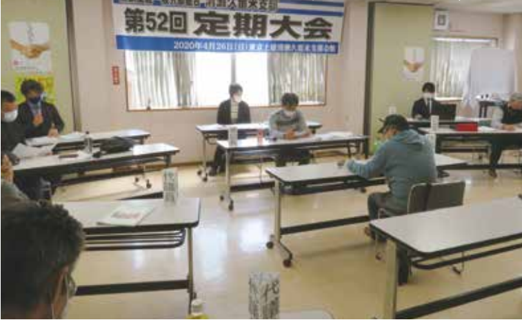
ステイホーム That leads us to protect our lives ステイイントウキョウ

4月26日(日)、第52回定期大会が清瀬久留米支部会館で開催されました。 今回は「コロナウイルスの影響もあり、参加者16人と少人数での開催となりましたが、新年度も引き続きKEYOKURU運動に「丸」で取り組むことを確認し、大会議案が承認されました。